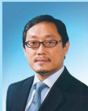
鄺志堅 議員 The Hon. KWONG Chi-kin